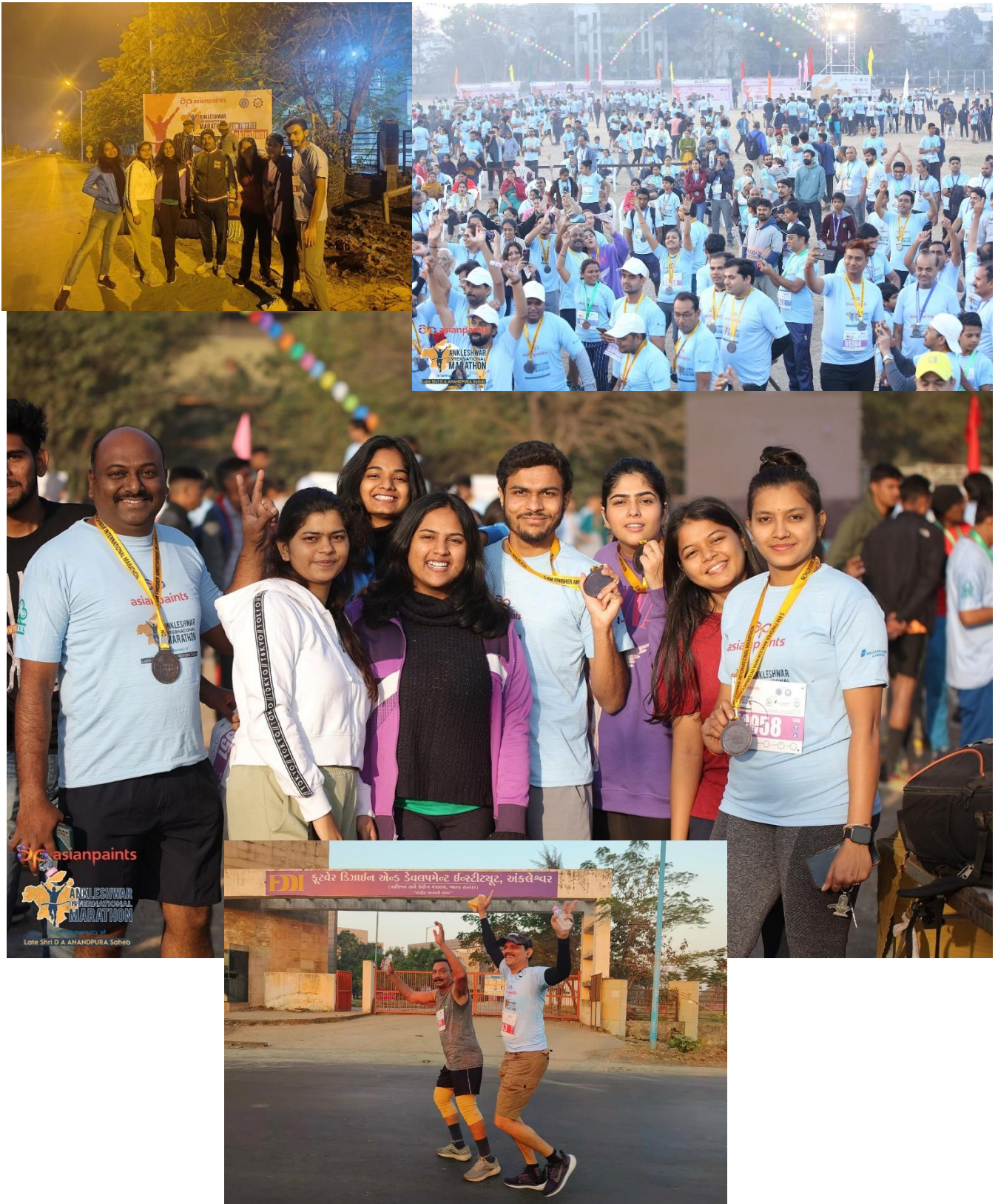
The medals have been awarded to the participants who have completed the marathon.