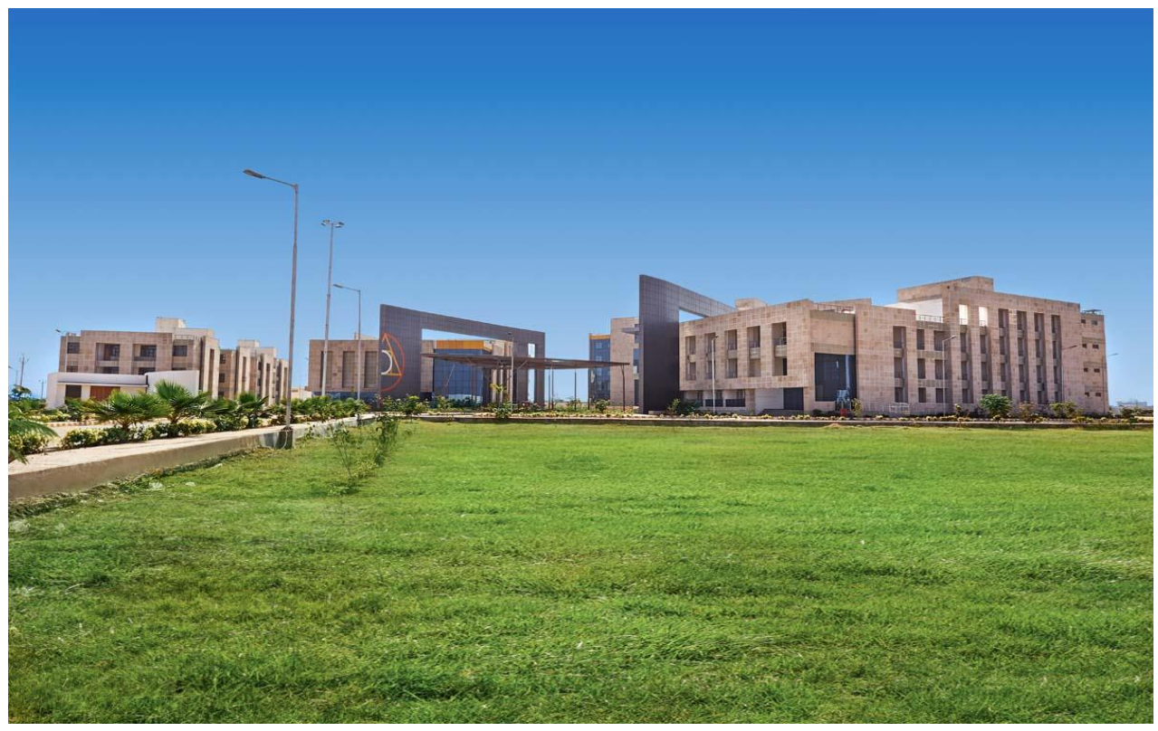
Address: H-3301 NEAR ESIC HOSPITAL, GIDC, Ankleshwar G.J. 393002