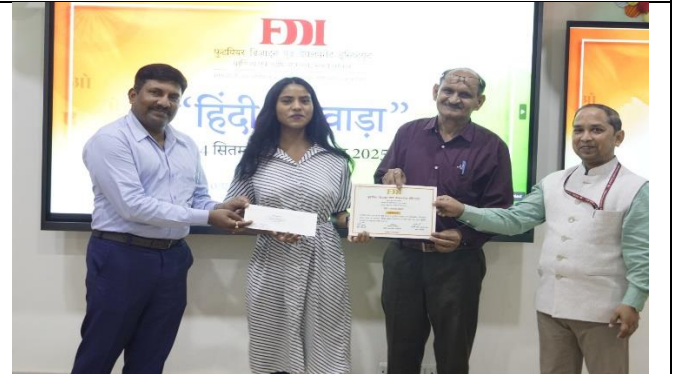
पुरस्कार प्राप्त करते विजेता