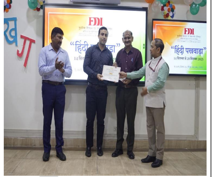
पुरस्कार प्राप्त करते विजेता